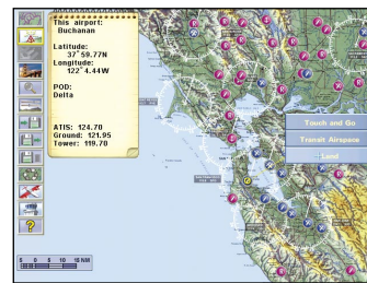
In der Bay Area stehen insgesamt 48 Flugplätze zur Verfügung.

Durch die Beschränkung auf eine relativ kleine Flugregion konnte Looking Glass der Landschaftsdarstellung viel Aufmerksamkeit schenken. Und die 3D-Engine zau-