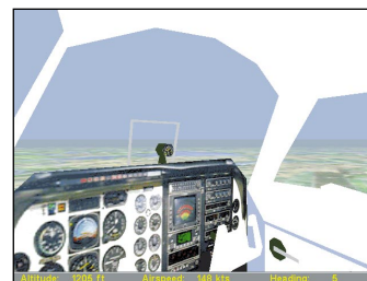
Die Instrumente im virtuellen Cockpit sind nicht zu gebrauchen.