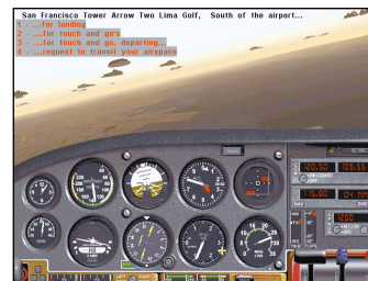
Der simulierte Funkverkehr sorgt für eine realistische Atmosphäre.

bert ein wirklich atemberaubendes Bild auf den Monitor. Neben den trotz Hardwarebeschleunigung hohen Systemanforderungen wären aber mehr 3D-Objekte und vor allem ein wirklich nutzbares virtuelles Cockpit wünschenswert gewesen. Wer San Francisco schon einmal besucht hat, wird Alcatraz, Fisherman's Wharf, die Golden Gate Bridge, die Transamerica-Pyramide, den Coit Tower sowie den 3Com und Candlestick Park mühelos wiedererkennen.